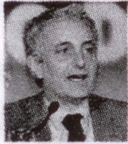
Il senatore Quagliariello

CON il duetto Quagliariello-Rutelli prendono il via oggi "Gli incontri del Melograno". L'appuntamento, organizzato dalla fondazione Magna Carta, è per 19,30 alla masseria del XVII secolo Il Melograno, nelle campagne di Monopoli. Il vicepresidente vicario del gruppo Pdl al Senato ed il presidente di Alleanza per l'Italia discute-